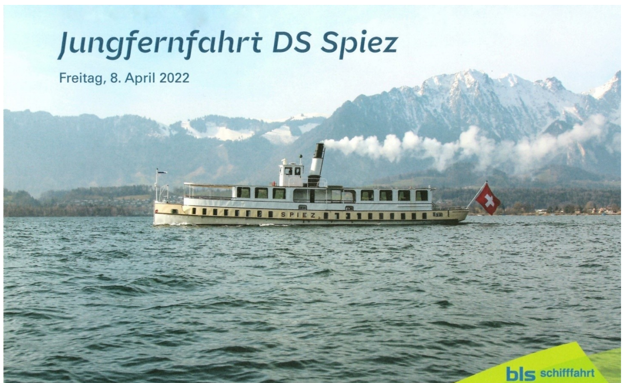
Bild 1: Am 8. April 2022 lud die BLS Schifffahrt zur Jungfernfahrt des revaporisierten DS SPIEZ.

Der nach einer umfassenden Revision mit einer neuen, fernbedienten Dampfmaschine ausgerüstete Schraubendampfer SPIEZ beförderte am 8. April 2022 erstmals Passagiere. Dank moderner Technik kann und darf das Dampfschiff wie ein Motorschiff mit einer Zweier-Besatzung fahren. Es ist für maximal 100 Fahrgäste zugelassen und eignet sich gut für Hochzeiten, Geburtstage, Klassentreffen und andere Feiern. Es soll daher vorwiegend im Charterbetrieb eingesetzt werden. Öffentliche Publikumsfahrten sind laut der BLS im Spätherbst nach Saisonschluss des grossen Raddampfers BLÜMLISALP geplant. Auf der Jungfernfahrt wurde von den geladenen Gästen die ruhige, vibrationsfreie Fahrt gelobt, die ein angenehmes Fahrgefühl vermittelt. Hauptgrund ist die spezielle Bauart der neuen Dampfmaschine. Die V-förmig unter 90° angeordneten Dampfzylinder ermöglichen einen nahezu perfekten Massenausgleich. Diese bei Dampfschiffen eher seltene Bauart wurde gewählt, weil das Behindertengleichstellungsgesetz und die neuen Vorschriften keinen sogenannten Deckdurchbruch erlaubten. Die originale, stehende Dampfmaschine baute viel höher und ragte in das Hauptdeck hinein. Dasselbe galt für die gebrauchten Dampfmaschinen, die zunächst in Betracht gezogen wurden. Alte Dampfmaschinen oder Replicas hätten zudem einen zusätzlichen, permanent anwesenden Maschinisten erfordert, was die Betriebskosten erhöht hätte.