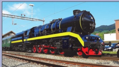
Dampflok 50 8055 der DLM (Dampflok- und Maschinenfabrik AG, Winterthur)

Stein am Rhein Etwilen Hemishofen Ramsen Rielasingen