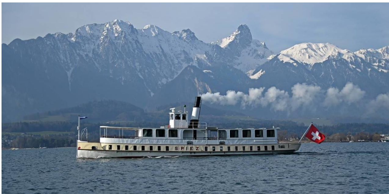
Bild 3: Probefahrt des revaporisierten Schraubenschiffs „SPIEZ“. Das Schiff wurde 1901 von Sulzer als kohlengefeuertes Dampfschiff gebaut. 1952 erfolgte ein Umbau auf Dieselbetrieb. Die alte Dampfmaschine wurde verschrottet. Die neue Dampfanlage mit automatischem Kessel und der neuen, fernbedienten Dampfmaschine ermöglicht den gleichen Personalbestand wie bei einem Motorschiff.

Erfreulicherweise lief unsere von Grund auf neu entwickelte Dampfmaschine auf Anhieb und ohne nachträgliche Korrekturen, was bei Prototypen nicht selbstverständlich ist.