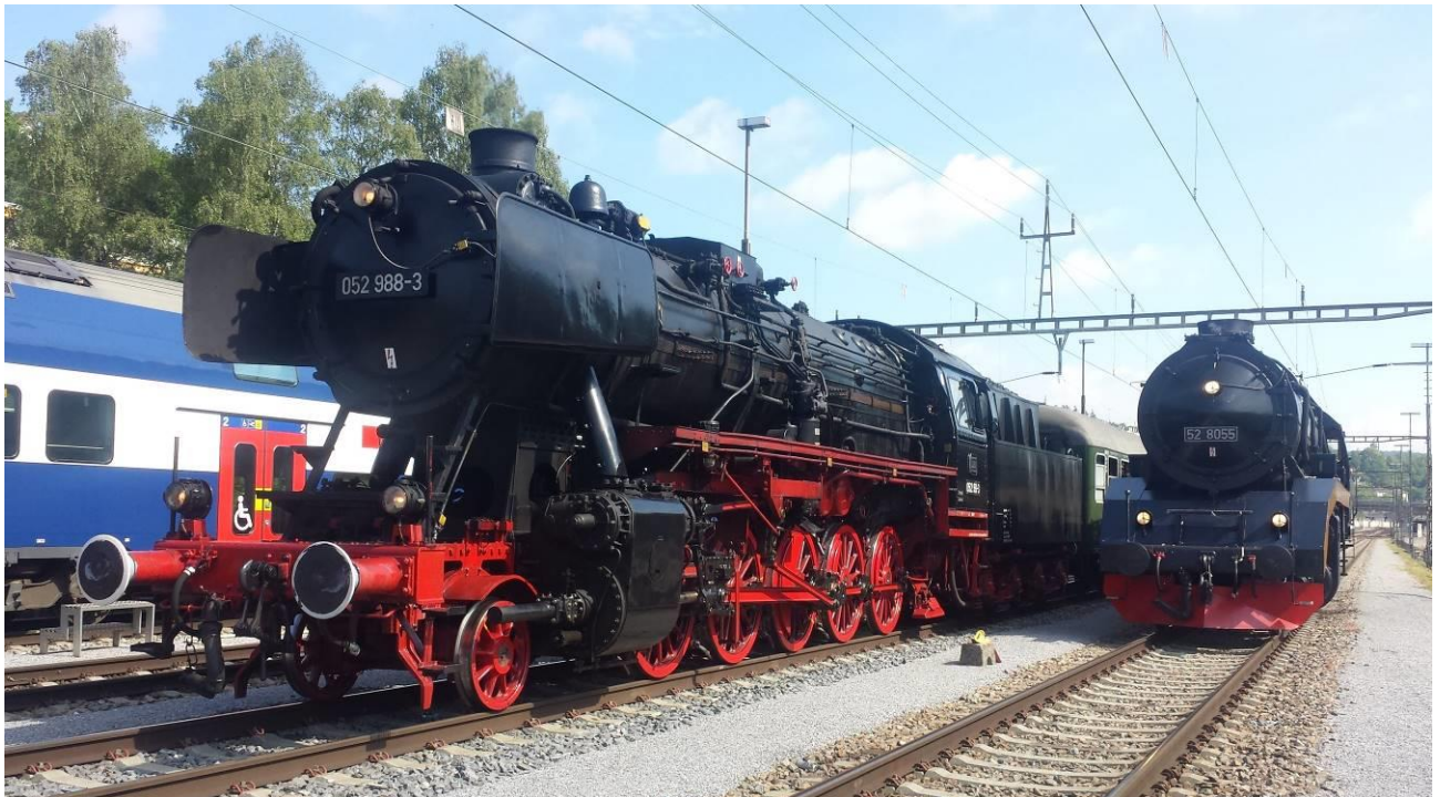
Bild 1: Lokwechsel in Schaffhausen am 10. Juni 2018. Die Dampflokomotive 052 988 (50 2988) übergibt den von Rottweil kommenden Zubringerzug der Eisenbahnfreunde Zollernbahn EFZ an unsere 52 8055.

Wir freuen uns, Ihnen am Samstag, den 4. September 2021 nach langer Pause eine öffentliche Dampffahrt anzubieten. Gestatten Sie zunächst einen kurzen Rückblick. Die bisher letzte Fahrt unserer 52 8055 fand am 10. Juni 2018 in Zusammenarbeit mit den Eisenbahnfreunden Zollernbahn (EFZ) und dem Dampfzentrum Winterthur (DZW) statt. Die EFZ brachten einen dampfgeführten Sonderzug von Rottweil nach Schaffhausen. Während die kohlengefeuerte 50 2988 und deren Lokpersonal in Schaffhausen pausierte, führte unsere 52 8055 den Zug weiter nach Winterthur, wo die Fahrgäste das Dampfzentrum besichtigen konnten. In der Zwischenzeit nutzten wir die Wagen für eine Rundfahrt mit der 52 8055. Dank dieser Kombination können wir Leerfahrten vermeiden und die Reisezugwagen relativ günstig mieten. Weil auch die Fahrgäste diese Angebote schätzten, planen wir die nächste Dampffahrt am 4. September 2021 in gleicher Weise durchzuführen.